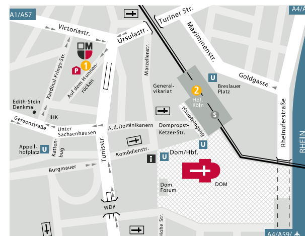
Die Zertifizierung der „Tagung zu ADHS bei Erwachsenen“ als Fortbildungsveranstaltung durch die Psychotherapeuten Kammer NRW wurde beantragt.